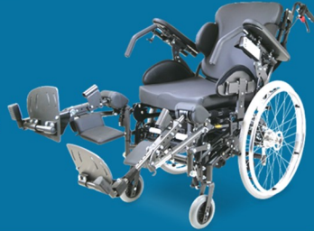
Einzel winkelverstellbare Beinstützen