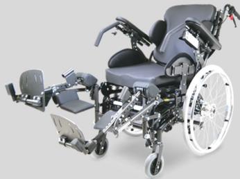
Einzel winkelverstellbare Beinstützen